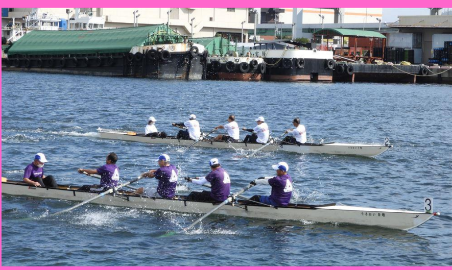
— 昨年のHAT神戸レガッタ —

国内ボート競技発祥の浜の一つとして知られる現在のHAT神戸で、有志たちの「ボートを復活させたい！」という思いから始まった「HAT神戸ボートコース設立実行委員会」も今年で10年目を迎えました。毎年多くの方にKOBEボート教室、HAT神戸レガッタに参加いただいています。わたしたちと一緒に市民の皆様やボート愛好家の方々と一緒に楽しいイベントづくりをしませんか？